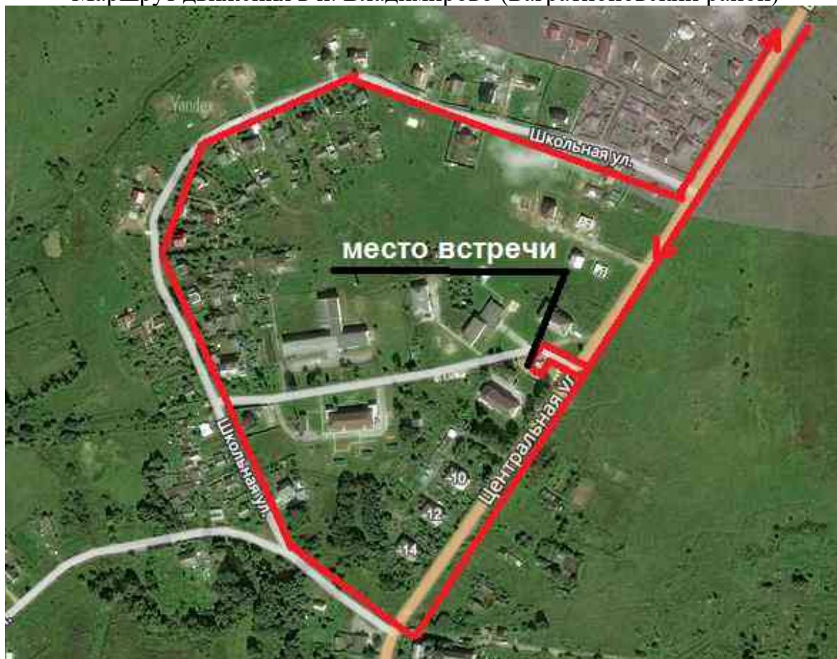
Маршрут движения в п. Северный (Багратионовский район)