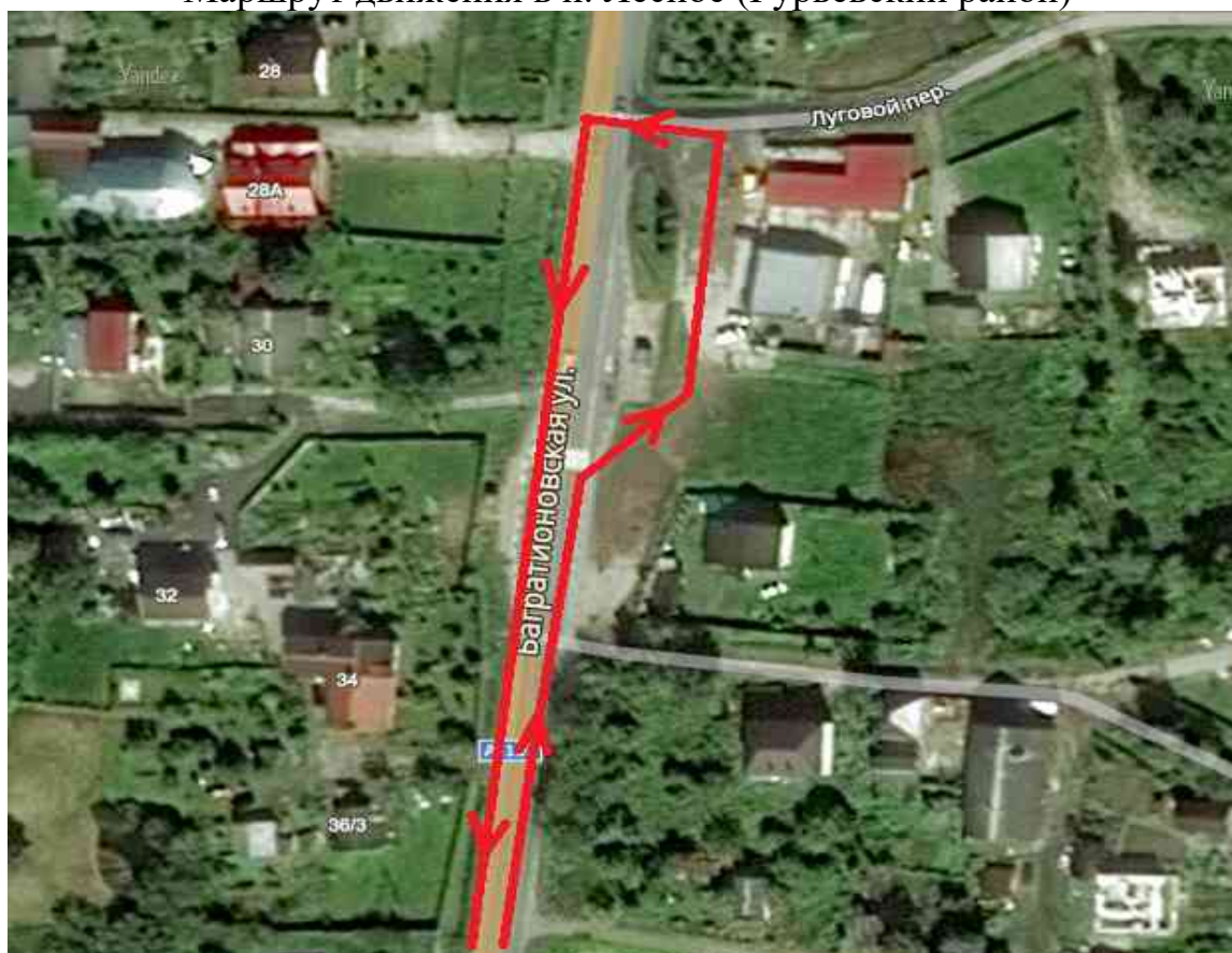
Маршрут движения в п. Партизанское (Багратионовский район)